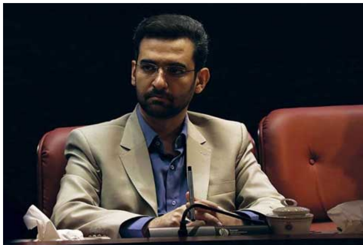
محمدجواد آذری جهرمی؛ رئیس جمهور جوان

گزینه اول ریاست جمهوری در سال ۱۴۰۰ تا این لحظه جواد آذری جهرمی است، وزیری که مورد اعتماد محمود واعظی، دست راست حسن روحانی، است و در دورانی که دولت در فشار است کارنامه بدی از خود به جا نگذاشته است.