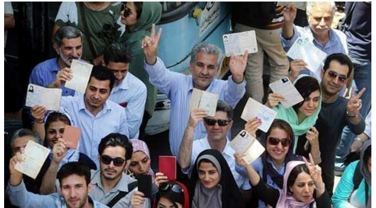
جوانگرایی مدنظر رهبر انقلاب

برترین ها: از ساعتی که بیانات رهبر معظم انقلاب در باره «دولت جوان و حزب الهی» منتشر شده، تفاسیر زیادی از این کلیدواژه بیرون آمده و برخی حتی گمانه زنی کرده اند که چه کسانی می توانند کاندیدای بالقوه چنین تعبیری باشند. گمانه زنی هایی که عمدتاً به سه نفر ختم شده؛ سورنا ستاری، محمدجواد آذری جهرمی و البته مهرداد بذریاش.